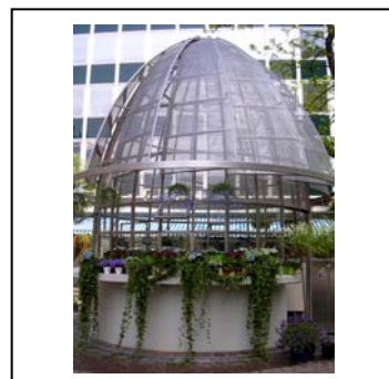
ジャン＝リュック・ヴィルムート参考作品 「BAR DES PLANTES」(2005) 本展では、植物と豊かに時間を過ごすカフェを演出します。